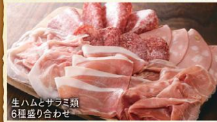
生ハムとサラミ類 6種盛り合わせ