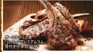
オーストラリア産 'jimba' プレミアムラム 骨付き仔羊のグリル