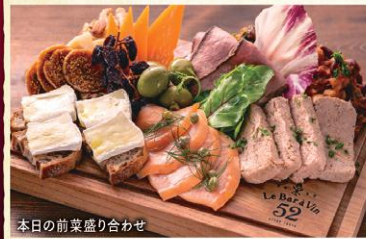
本日の前菜盛り合わせ