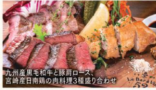
九州産黒毛和牛と豚肩ロース、 宮崎産日南鶏の肉料理3種盛り合わせ