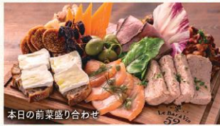
本日の前菜盛り合わせ