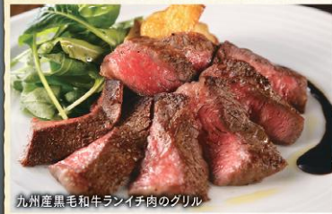
九州産黒毛和牛ランイチ肉のグリル