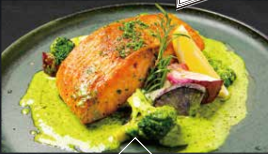
青森サーモンのムニエル ブルゴーニュバターソース

Aomori salmon Meunière with Bourgogne butter sauce