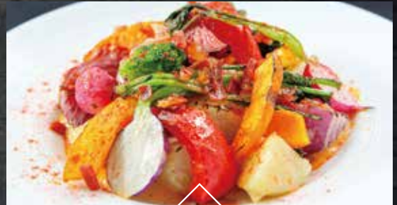
三浦半島青木農園野菜と彩り野菜の オーブン焼き 生ハムとアイオリソース