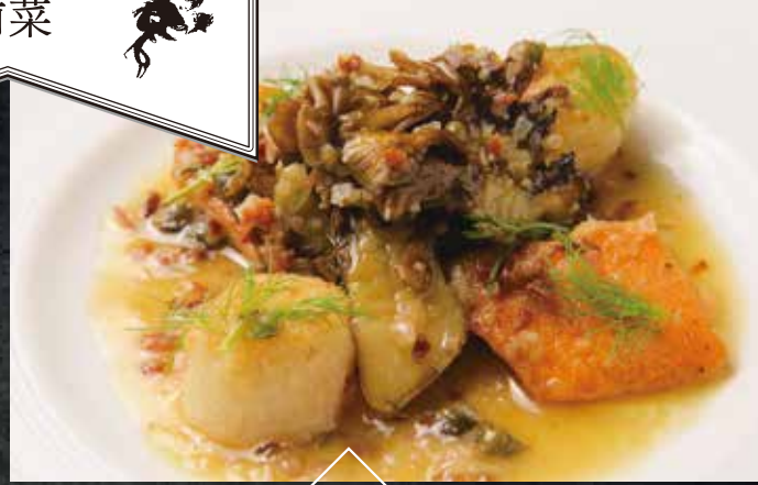
北海道産帆立と青森サーモンのムニエル ～ハーブ香るケイパーソース～

パセリや青森田子産ニンニクを入れたブルゴーニュバターと生クリームで仕立てたソースと合わせます。 お好みでレモンを絞ってお召し上がりください。