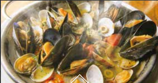
ムール貝と殻付きあさりの 白ワイン蒸し

北の海が育んだ甘みの強い帆立とサーモンを、タイムやローズマリーが香るバターで焼き上げました。熟成生ハムの深いコクとケイパーの爽やかな酸味がアクセントを添える、芳醇なソースでお楽しみください。