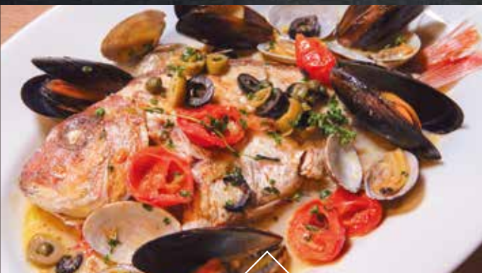
熊本天草産の魚とムール貝、殻付きあさり、 セミドライトマトのアクアパッツァ

青森田子にんにくを香ばしく焦がし、自家製アイオリソースに仕立てています。 ハーブと共に甘味を引き出すようにオーブンで焼き上げた野菜を、生ハムとアイオリソースでご堪能ください。